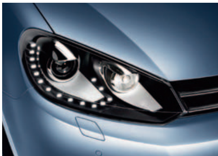
Bi-Xenon Scheinwerfer mit LED-Tagfahrlicht