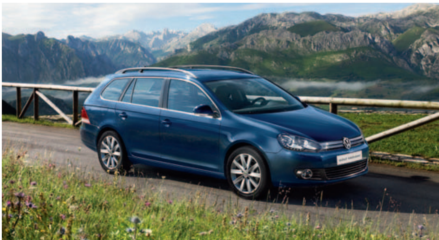
Abbildung enthält Sonderausstattungen